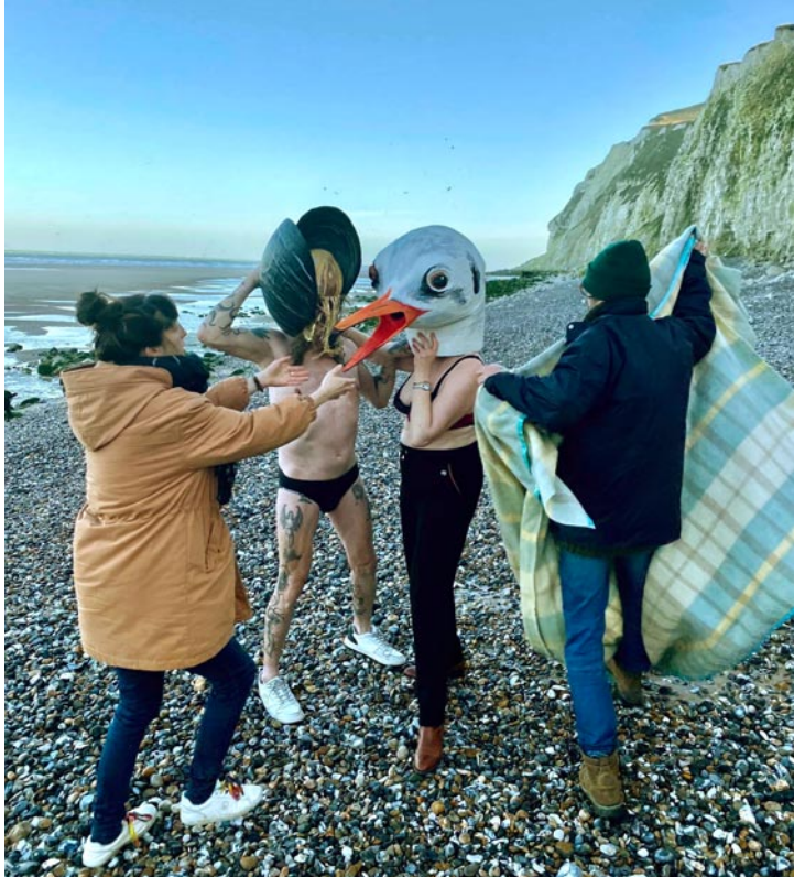
Séance photo du collectif Maison mer, bien au frais au pied du Cap Blanc-Nez, vendredi 6 décembre 2024.

Billetterie 03 21 46 77 00 Site www.lechannel.org