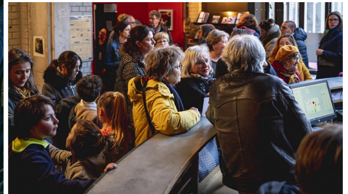
En attente de places, billetterie du Channel