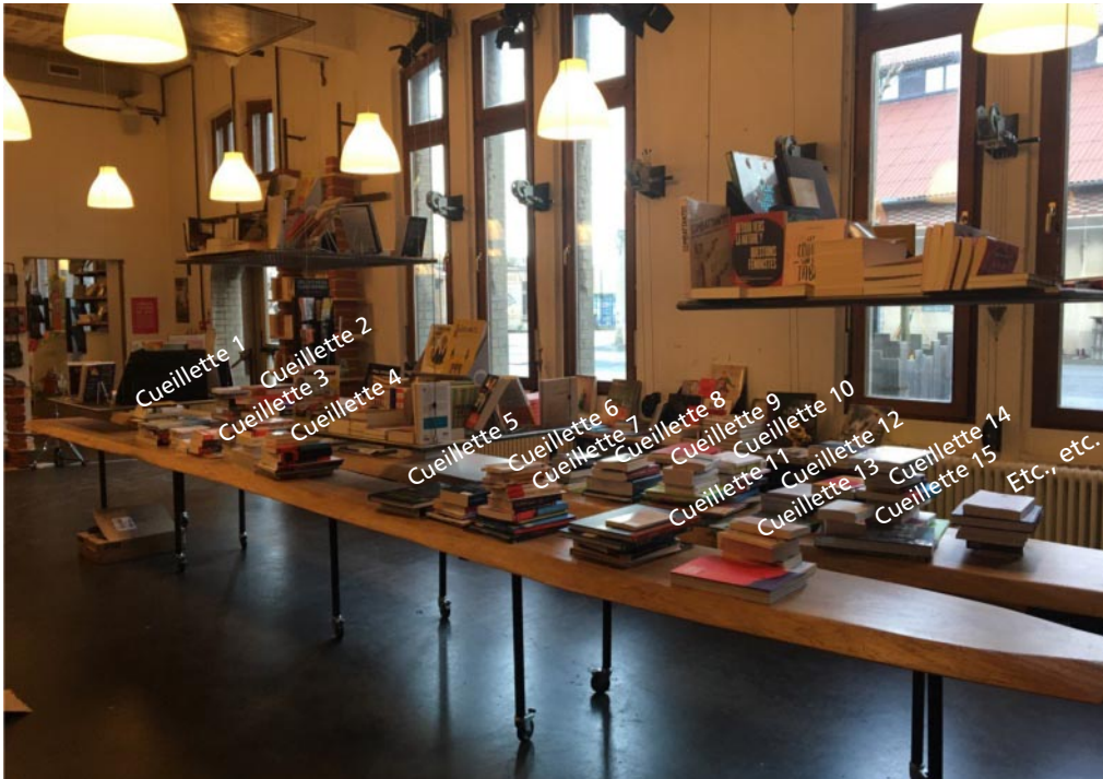
Livres en attente de cueillette.

Chèques Mon Shopping, c'est Calais également acceptés.