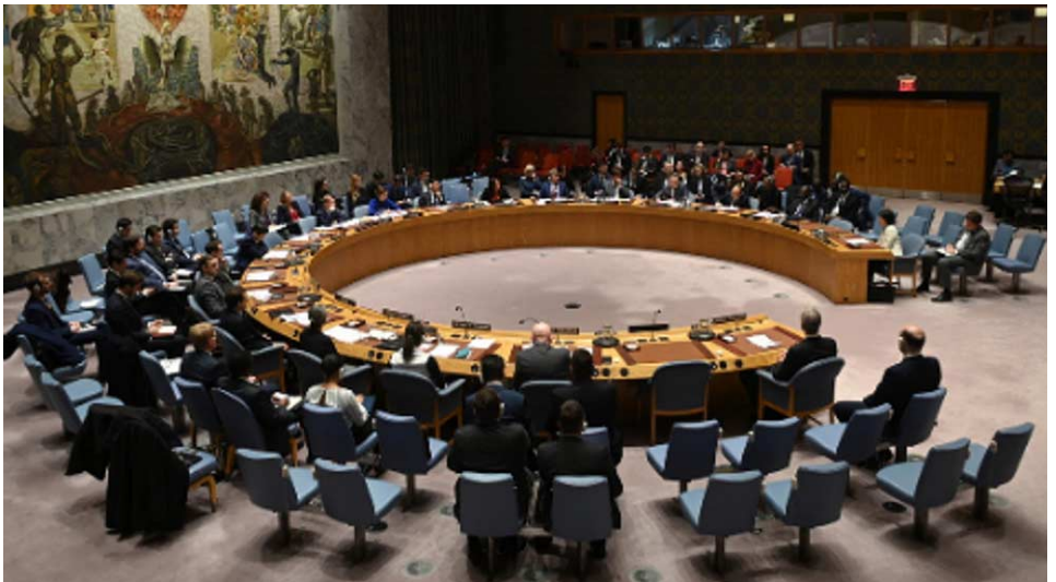
Siège de l'ONU, New York