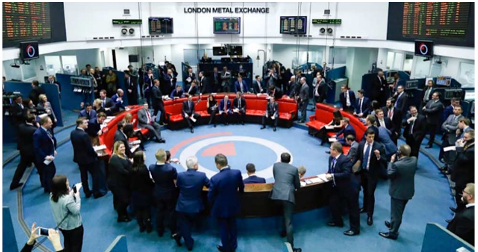
Ring de la London Metal Exchange