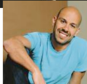
Correria et Agwa Compagnie Käfig, Mourad Merzouki

dans tous ses styles, se greffe pour ce chorégraphe un intérêt pour le cirque et les arts martiaux mais encore les arts plastiques et la musique live . Sans perdre de vue les racines du mouvement, ses origines sociales et géographiques, cette confrontation lui permet d'ouvrir de nouveaux horizons et d'enrichir sa pratique chorégraphique. Ainsi, son dernier spectacle, Boxe boxe , est une exploration de la gestuelle de la boxe. C'est en 1996 que Mourad Merzouki a fondé sa propre compagnie, Käfig. Depuis 2009, il assure la direction du Centre chorégraphique national de Créteil et du Val-de-Marne, succédant à d'illustres prédécesseurs, entre autres Maguy Marin et José Montalvo.