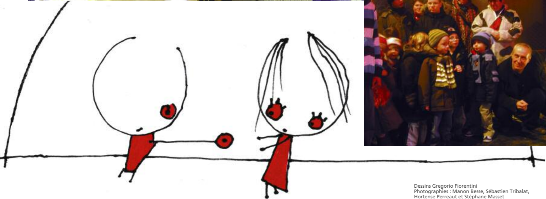
Dessins Gregorio Fiorentini