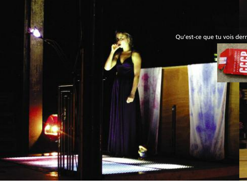
Qu'est-ce que tu vois derrière l'horizon ?