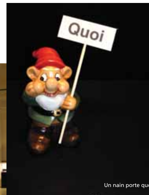
Un nain porte quoi

Exposition jusqu'au dimanche 3 avril 2005 à la galerie de l'ancienne poste (du mardi au dimanche de 14h à 18h, sauf jours fériés)