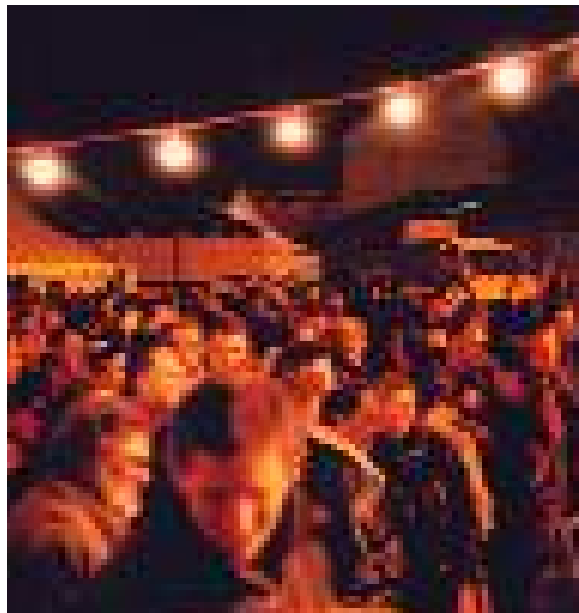
Des spectateurs au rendez-vous ( Feux d'hiver )