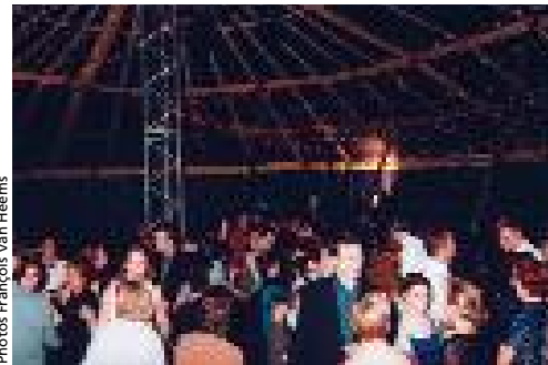
Un chapiteau qui n'a pas désepli ( Feux d'hiver )

Non nominative, valable un an à partir de la date d'achat pour tous les spectacles du Channel et les séances au cinéma Louis Daquin