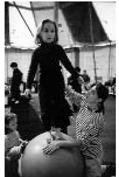
Les enfants font le cirque ( Feux d'hiver )