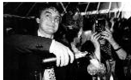
Caviar pour les autres? ( Feux d'hiver )