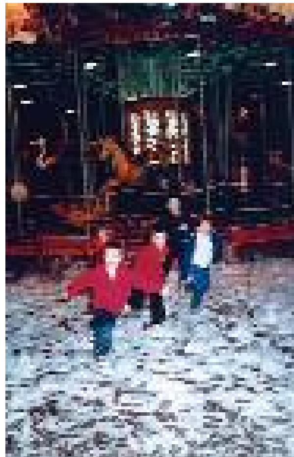
Neige et manège ( Feux d'hiver )