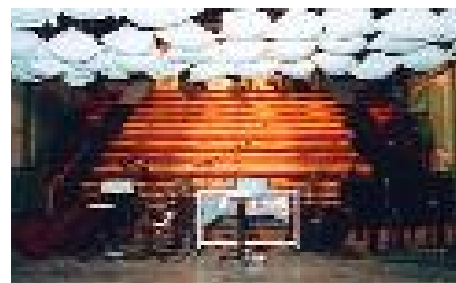
Vue passagère du Passager ( Inauguration du Passager )