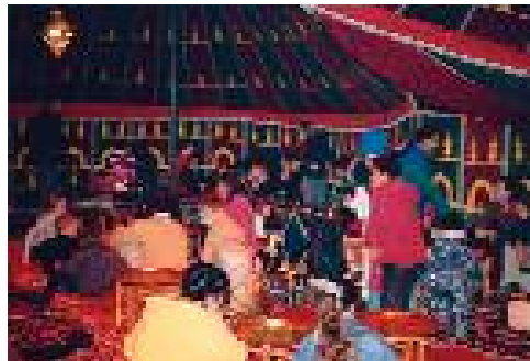
Accueil à l'orientale ( Feux d'hiver )