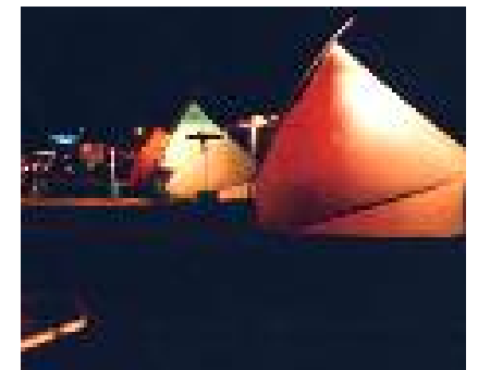
Cour des abattoirs avant l'heure H ( Inauguration du Passager )