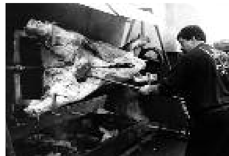
Le bœuf du nouvel an ( Feux d'hiver )