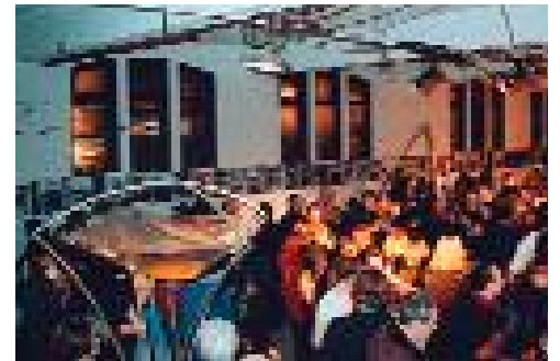
Ilotopie offre à boire ( Inauguration du Passager )