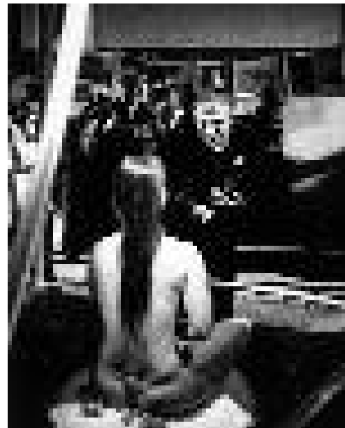
Ne pas en croire ses œufs ( Inauguration du Passager )