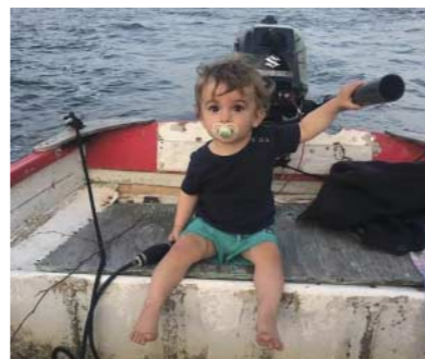
Cérémonie En attendant Gus Sébastien Barrier vendredi 27 et samedi 28 novembre 2020 à 18h Durée: 1h ou plus Entrée libre, sur réservation À partir de 14 ans