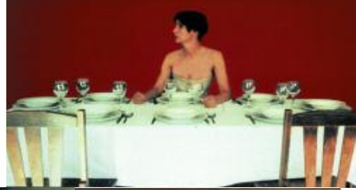
Spectacle en boîte Dans ma maison Théâtre de chambre

Dans ma maison est une histoire nomade formée de sédiments de rencontres et d'errances. Chacun de ses épisodes est abrité dans un container en bois, articulé. Ce sont des boîtes à voyages comme des réalités ouvertes sur le monde, à l'intérieur desquelles s'inventent les rêves, les pérégrinations du corps et de l'esprit, les désirs de vivre. Nous sommes installés de part et d'autre de chaque boîte. Elles nous offrent un conte singulier de la vie ordinaire, un conte ordinaire de la vie étrangère.