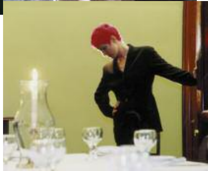
Performance dînatoire à l'hôtel des artistes The secret room – La chambre secrète Iraa theater

Nous sommes quelques hôtes à être reçus chez une femme. Alors que nous osons tout juste communiquer avec nos voisins spectateurs, elle nous sert à dîner, s'installe avec nous et s'immisce dans nos conversations, ouvrant ainsi un dialogue spontané. Les choses se troublent après le repas. La situation si familière, si étrangement ordinaire du début, s'intensifie alors. L'expérience est saisissante.