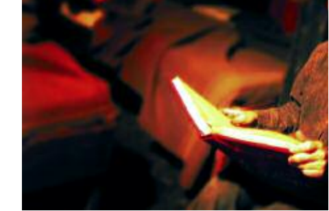
Fable sonore Buchettino Societas Raffaello Sanzio

Buchettino – petit trou en français – est la traduction italienne de Petit poucet . Nous sommes accueillis à l'intérieur d'une chambre en bois. Tout le monde est invité à enlever ses chaussures et enfiler un pyjama. Une femme pauvrement vêtue prend place au centre, sur un petit tabouret. Elle commence la lecture du conte. Alors que nous écoutons, recueillis dans la pénombre, l'histoire ressuscite à travers les parois. Nous percevons le son réel des choses et la présence vorace de l'ogre, le conte de Charles Perrault nous enveloppe petit à petit, d'une manière étrangement palpable. Il ravive sans édulcoration les joies et les peurs secrètes qui fondent la fable et la maintiennent en vie depuis trois cents ans. Effrayant et merveilleux.