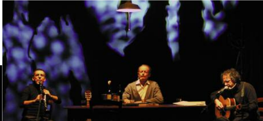
Parcours sonore L'assente – L'absent tiré de La douleur de Marguerite Duras Teatro delle Arie

Nous travaillions, mon mari et moi, à une réécriture d'Antigone dans le contexte de la seconde guerre mondiale. Dans une librairie, je suis tombée sur un livre de Marguerite Duras, un recueil de nouvelles: La douleur.