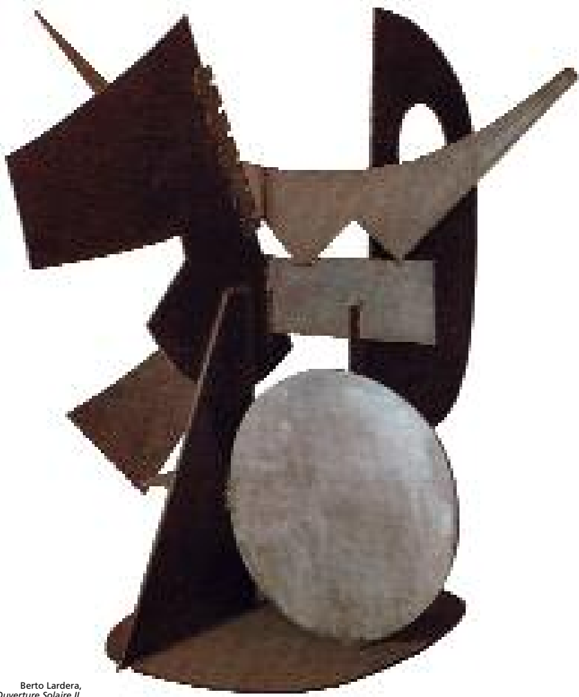
Berto Lardera, Ouverture Solaire II , collection de l'artiste

L'exposition sera visible tout l'été. Une partie à la Galerie de l'ancienne poste, l'autre au Musée des beaux-arts et de la dentelle de Calais. Plongée dans la sculpture du XX e siècle.