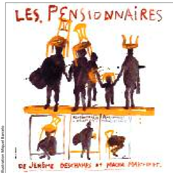
Illustration Miquel Barcelo